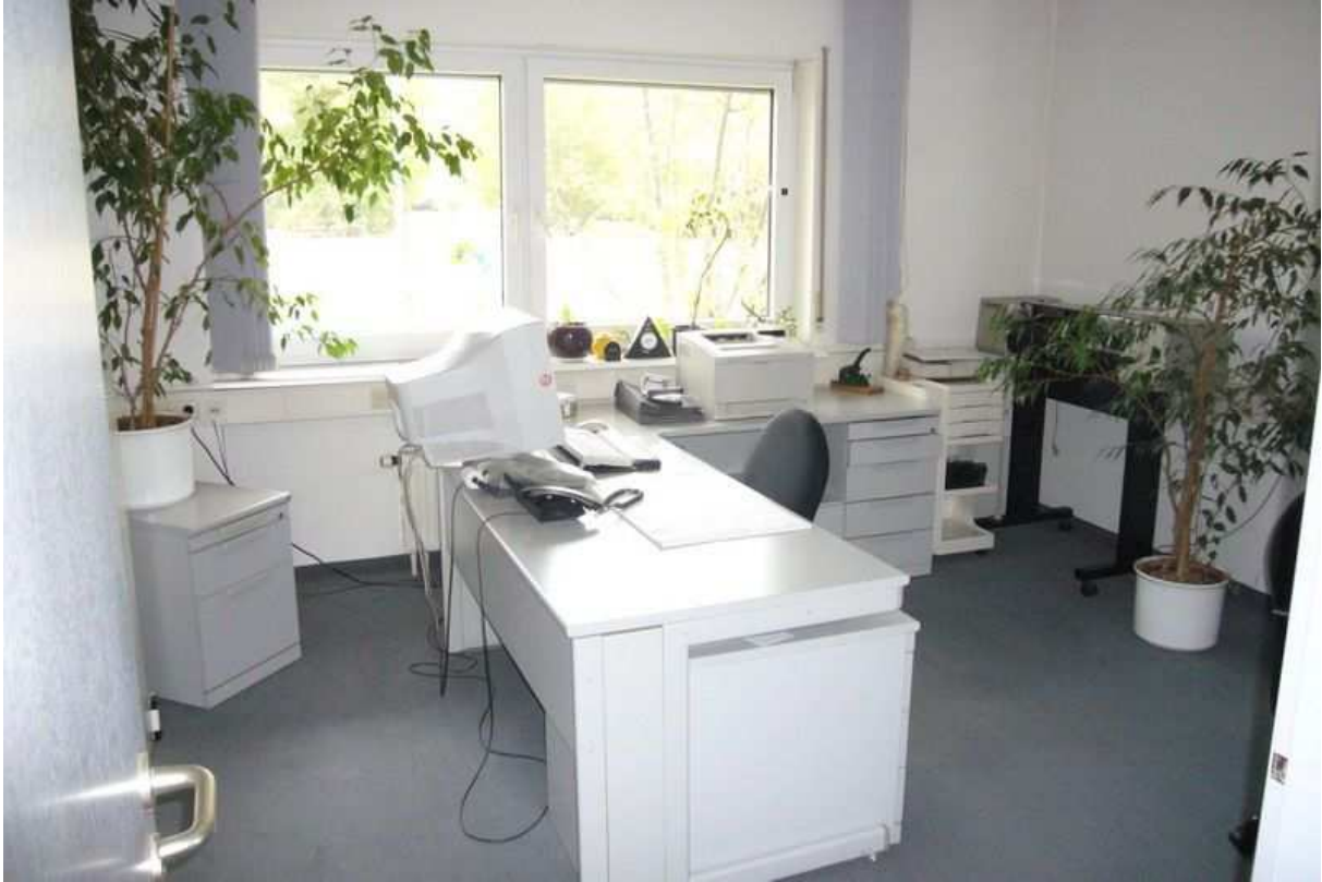
Bürozimmer mit Einrichtung